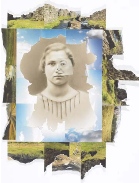
Lejo, zeitpunkt, 2010, Fotocollage, 60 x 47 cm