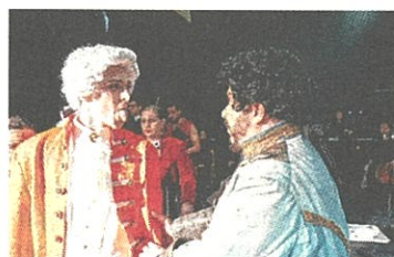
Mozart - die erste künstliche Intelligenz?

haupt begraben wurde. Doch die viel entscheidendere Frage ist folgende: Was wäre, wenn etwas von Mozart noch am Leben wäre? In der Kammeroper „Der Mozartautomat“ erfährt man schier Unglaubliches darüber. Ziel des Projekts ist es, neue Gedankenwelten und Klangräume zu eröffnen.