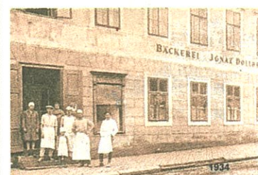
Hauptstraße 145, Bäckerei und Konditorei Dollberger.

3 KIERLING. Der Kalender „Kierling auf alten Postkarten“ hat begeisterte Aufnahme gefunden. Diesem Erfolg wird nun mit einem Vortrag „Kierling alt – neu“ Rechnung getragen. Aus dem Archiv des Museums hat die Museumsdirektorin Christl Chlebeck eine einmalige Dokumentation zusammengestellt. Die Beamerpräsentation findet am Freitag, den 11. März um 18:30 Uhr im Museum Kierling statt. Für das leibliche Wohl wird natürlich auch gesorgt. Bitte die für Niederösterreich jeweils geltenden Covid-Bestimmungen beachten.