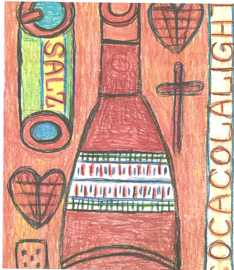
▲ Gaumenfreuden stehen ganz im Fokus der neuen Werkschau in der „galerie gugging“, wo vor allem die Werke von August Walla Appetit machen sollen.

„MELLITIUS!“ „galerie gugging“ Mittwoch, 09. März 10.00 bis 21 Uhr Informationen unter www.galeriegugging.com