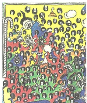
Manuel Griebler 2022

Zu folgenden Öffnungszeiten: Freitag, 18 bis 20 Uhr; Sonntag, 10 Uhr bis 12 Uhr oder nach Vereinbarung unter 0664/654 79 86 oder museum.kierling@inode.at