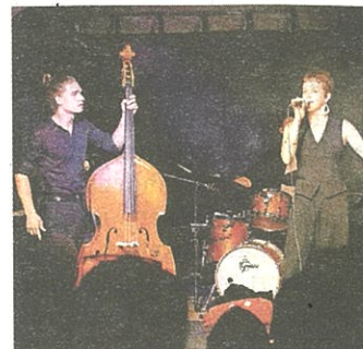
Das „Trio zu Viert“ spielt seit über zwei Jahren regelmäßig.