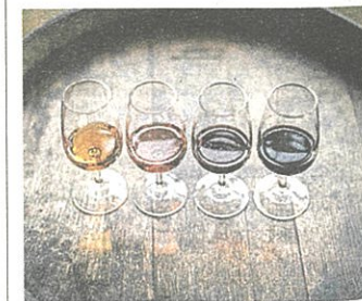
Probieren Sie sich durch die Jahrzehnte.

Begeben Sie sich auf eine kulinarische Zeitreise und probieren Sie sich durch die Jahrzehnte! Eine Anmeldung verpflichtend unter: Tel.: 02241 548 bzw. vinothek@stkl Klosterneuburg.at.